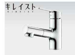
WU100WN シングルホール洗面混合栓(ホースタイプ) ※本製品は株式会社タカギ製品です。 https://www.takagi.co.jp/