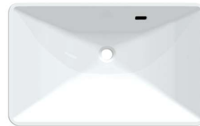
KMB5AGW-1 シームアンダー用