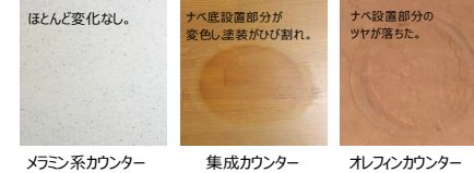
メラミン系カウンター 集成カウンター オレフィンカウンター