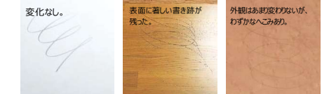
メラミン系カウンター 集成カウンター オレフィンカウンター