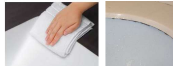
シームアンダーデザイン 一般的なアンダーボウル

汚れが染み込みにくく、お手入れカンタンな人工大理石ボウル。シームアンダー加工の一体納まりでは、カウンター本体とボウルが段差なくつながり、内側にコーキング処理もありませんので、お手入れも簡単。カビの繁殖原因にもなる汚れ溜まりもありません。