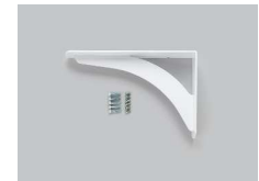
KH-340WA ×3本 白 1セット(1本入り)