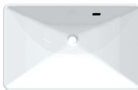
KMB5AGW-1 シームアンダー用