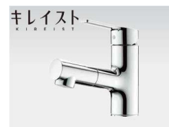
WU100WN シングルホール洗面混合栓(ホースタイプ) ※本製品は株式会社タカギ製品です。 https://www.takagi.co.jp/