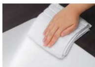
シームアンダーデザイン

汚れが染み込みにくく、お手入れカンタンな人工大理石ボウル。シームアンダー加工の一体納まりでは、カウンター本体とボウルが段差なくつながり、内側にコーキング処理もありませんので、お手入れも簡単。カビの繁殖原因にもなる汚れ溜まりもありません。