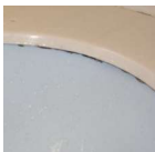
一般的なアンダーボウル