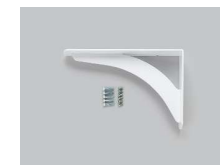
KH-340WA ×3本 白 1セット(1本入り)